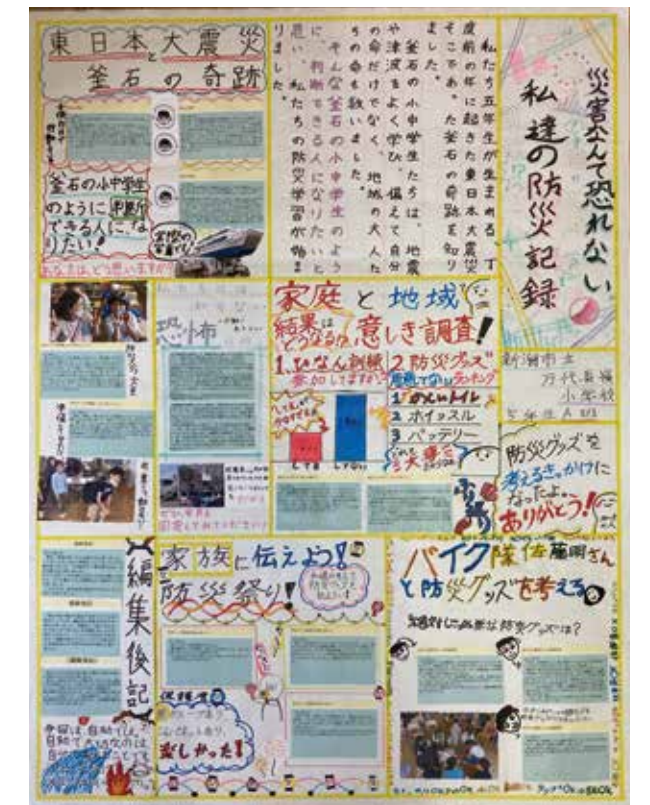
【小学校高学年の部】 新潟市立万代長嶺小学校5年生A班 作品名：災害なんて恐れない 私たちの防災記録