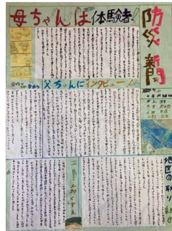
【小学校中学年の部】 長岡市立脇野町小学校4年松組3班 作品名：防災新聞