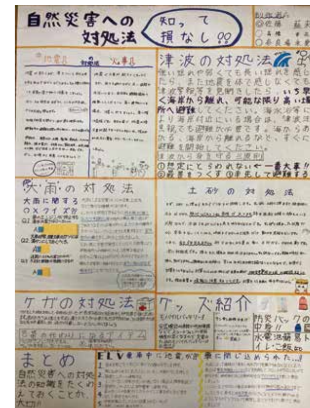
【中学生の部】 長岡市立栖吉中学校1組5班 作品名：自然災害への対処法

※その他の入賞作品は、右のQRコードから動画にてご覧いただくか、～よりよい未来の新潟を子どもと一緒に創るプロジェクト～こども防災未来会議®2023実施報告書をご覧ください。